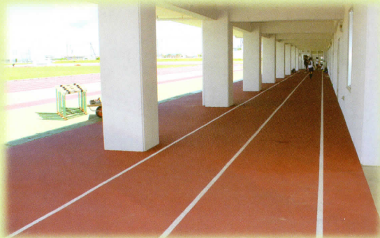
屋内トレーニングコース